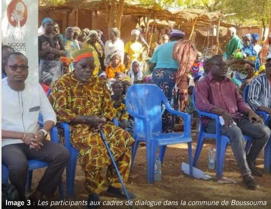
Image 3 : Les participants aux cadres de dialogue dans la commune de Boussouma