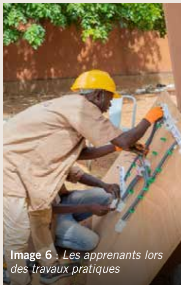
Image 6 : Les apprenants lors des travaux pratiques