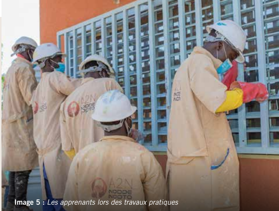
Image 5 : Les apprenants lors des travaux pratiques