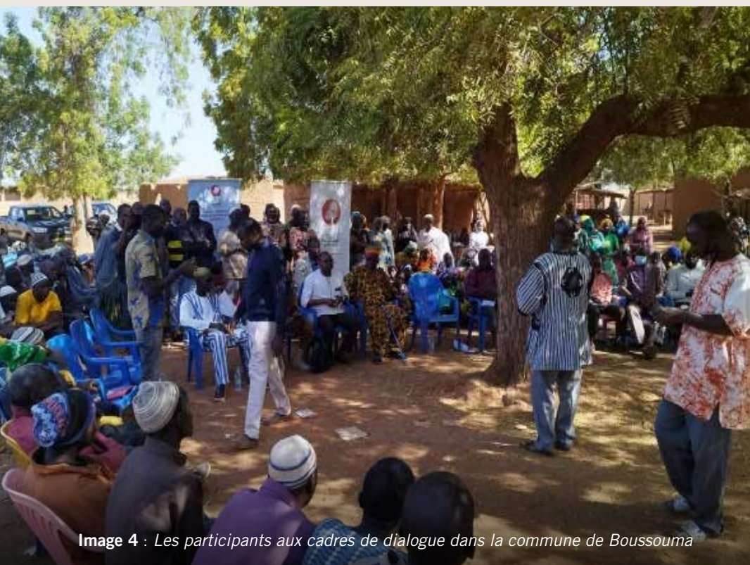
Image 4 : Les participants aux cadres de dialogue dans la commune de Boussouma

03 cadres de dialogue inclusif entre populations hôtes et PDI ont été organisés dont deux (02) dans la région du Centre-Nord plus spécifiquement dans la commune de Boussouma (Tanhoko et Sera) et un (01) au Sahel dans la commune de Bani. Ces cadres de dialogue ont permis de toucher au total 429 personnes dont 115 hommes et 314 femmes. Au Centre-Nord, on a enregistré une participation de 314 personnes dont 93 hommes et 221 femmes. Parmi ces participants, on dénombre 57 PDI dont 19 hommes et 38 femmes. Au Sahel, la participation était de 115 participants dont 56 hommes et 59 femmes. Ces cadres ont été organisés avec l'appui des services techniques et de la délégation spéciale de la commune de Boussouma et Bani.