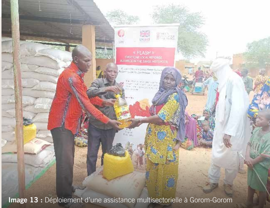
Image 13 : Déploiement d'une assistance multisectorielle à Gorom-Gorom