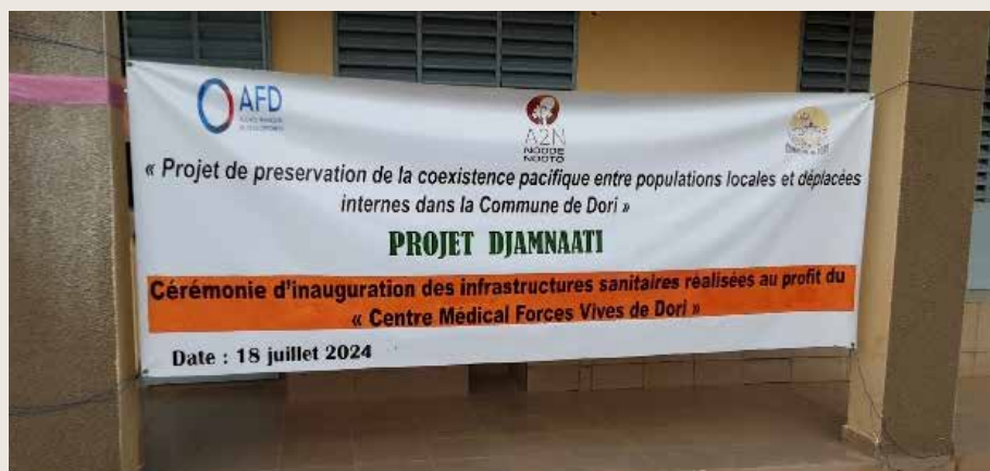
Images 1 & 2 : Cérémonie d'inauguration des infrastructures sanitaires

01 étude diagnostique fonctionnelle et organisationnelle assortie d'un plan de renforcement a été réalisée pour la mairie de Dori. Cette étude a permis d'identifier les forces et faiblesses des structures concernées et de proposer des recommandations pour améliorer leur efficacité.